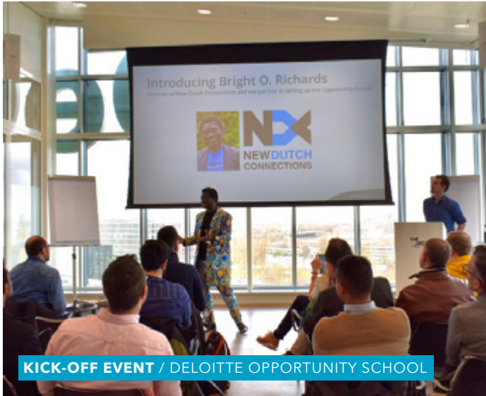
KICK-OFF EVENT / DELOITTE OPPORTUNITY SCHOOL