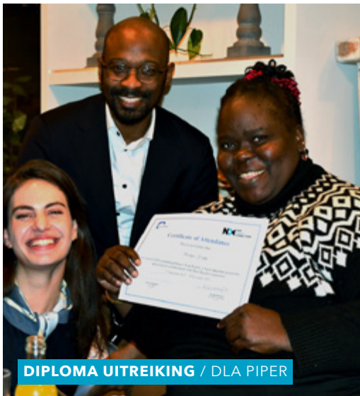
DIPLOMA UITREIKING / DLA PIPER