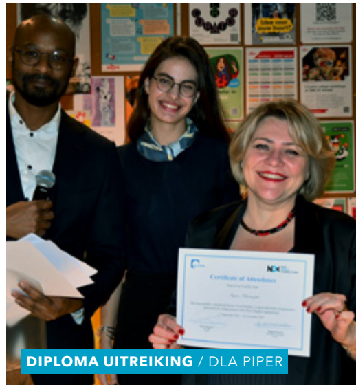
DIPLOMA UITREIKING / DLA PIPER