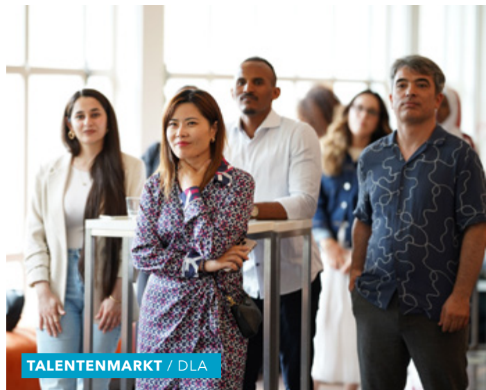
TALENTENMARKT / DLA