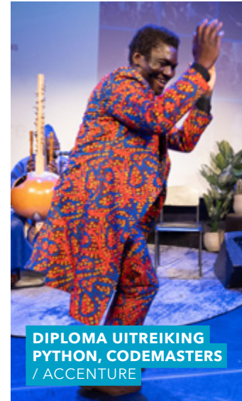
DIPLOMA UITREIKING PYTHON, CODEMASTERS / ACCENTURE