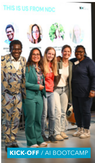
KICK-OFF / AI BOOTCAMP